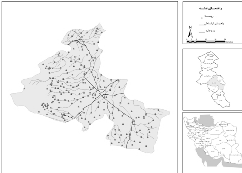
نقشه ۱: پراکنش فضایی نقاط روستایی شهرستان اردبیل

اردبیل، یکی از شهرستان‌های استان اردبیل و مرکز آن است. وسعت این شهرستان ۳۸۱۰ کیلومتر مربع است و چهره عمومی شهرستان اردبیل، متأثر از ارتفاعات کوهستان‌های سبلان، طالش و بزغوش است که این عوامل طبیعی، سبب محصور شدن آن شده‌اند. این شهرستان - به عنوان یکی از مناطق سردسیر ایران - بین پنج تا هشت ماه از سال سرد است. اردبیل، از شمال به شهرستان نمین، از جنوب به گیوی، از غرب به مشکین‌شهر و از شرق به استان گیلان محدود است. جمعیت این شهرستان - بر اساس سرشماری سراسری سال ۱۳۹۰ ایران - برابر با ۲۷۴۲۰۵ نفر است که از این بین، ۱۵۰۹۴۱ نفر در نقاط شهری و ۱۲۳۲۶۴ نفر در نقاط روستایی ساکن هستند. این شهرستان دارای ۳ شهر به نام اردبیل، هیر و سرعین است. هم‌چنین، شهرستان اردبیل دارای سه بخش، ۱۱ دهستان، ۳۲۹ آبادی دارای سکنه است. در نهایت نقشه شماره (۱) محدوده مورد مطالعه را در سطح کشور و توزیع جغرافیایی روستاها را در محدوده شهرستان نشان می‌دهد.