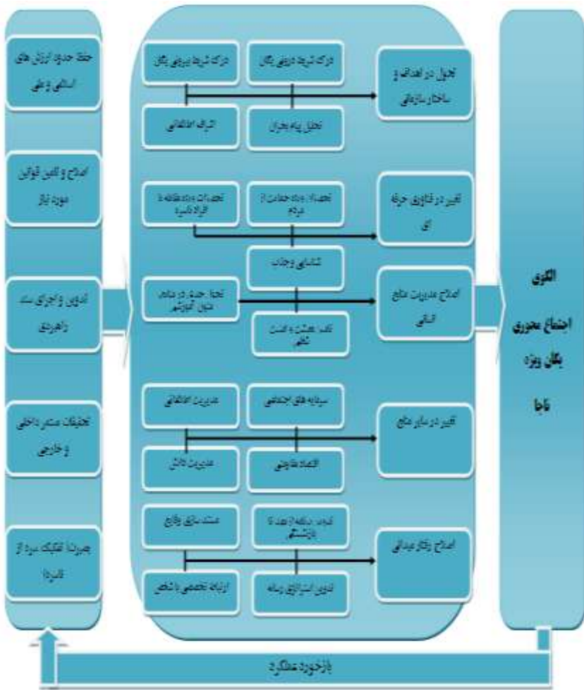
شکل ۱: الگوی مفهومی اجتماع محوری یگان ویژه ناجا

مفهومی تهیه و در نهایت پس از چندین بار اصلاح مدل اولیه پژوهش به شکل زیر طراحی گردید.